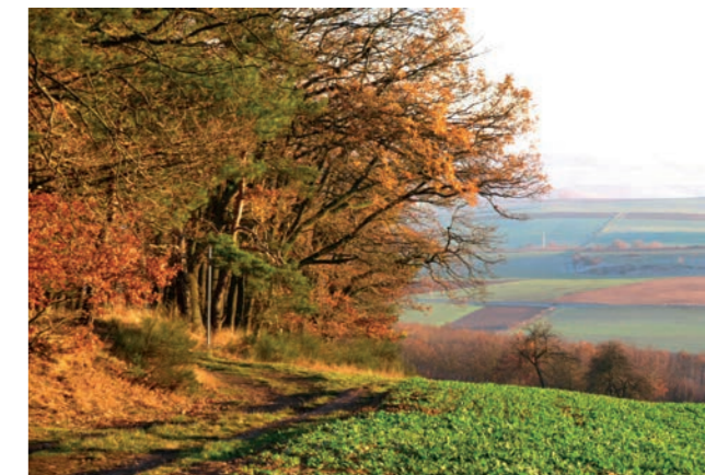
Weg am Waldrand