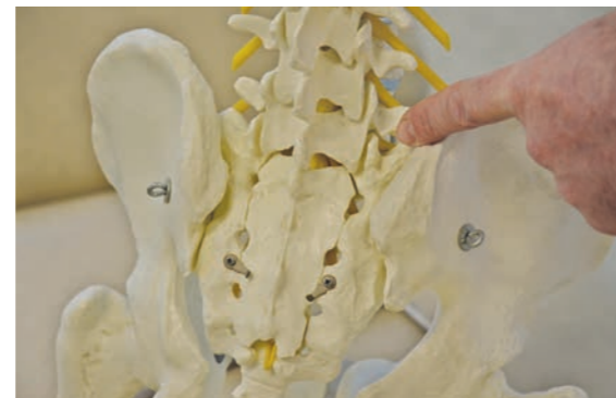
Mit der Wirbelsäule kennen wir uns aus