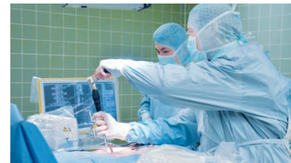
Moderne OP-Technik und exzellentes Know-how: Dafür steht die Wirbelsäulenchirurgie am Diakonie Krankenhaus

Einschränkungen beim Gehen und in die Beine ausstrahlende Schmerzen sind häufig Zeichen einer Einengung des Spinalkanals. Neben konservativen Maßnahmen im Frühstadium (s.o.) bringt die operative Erweiterung des Spinalkanals oft gute Erfolge. Diese Eingriffe werden an Hals-, Brust- und Lendenwirbelsäule durchgeführt.