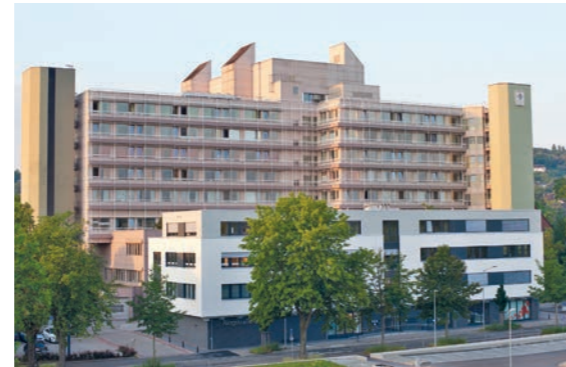
Wirbelsäulenchirurgie Bad Kreuznach