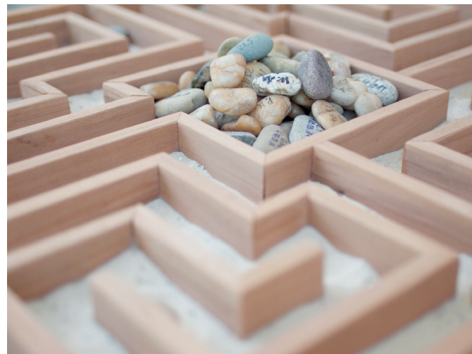
Leben und Sterben im Hospiz – jeder Tag ist ein Geschenk

Bitte helfen Sie uns regelmäßig als Pate und tragen Sie dazu bei, die stationäre Hospizarbeit im Hunsrück langfristig zu sichern.