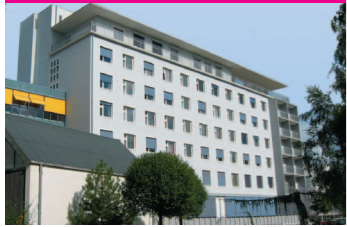
Evangelisches Stadt Krankenhaus Saarbrücken

Fachabteilungen: Innere Medizin, Chirurgie, interdisziplinäre Intensiv-Abteilung sowie Orthopädie, Paul Marien Hospiz