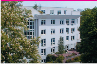
Fliedner Krankenhaus Neunkirchen

Fachabteilungen: Innere Medizin, Diabetologie/Endokrinologie, interdisziplinäre Intensiv-Abteilung, Psychiatrie und Psychotherapie mit angeschlossener Tagesklinik für psychisch Kranke, Fortbildungszentrum